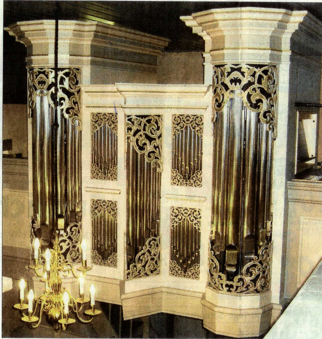
Die neue Martin ter Haseborg-Orgel wird heute um 14 Uhr in Holtorf geweiht.