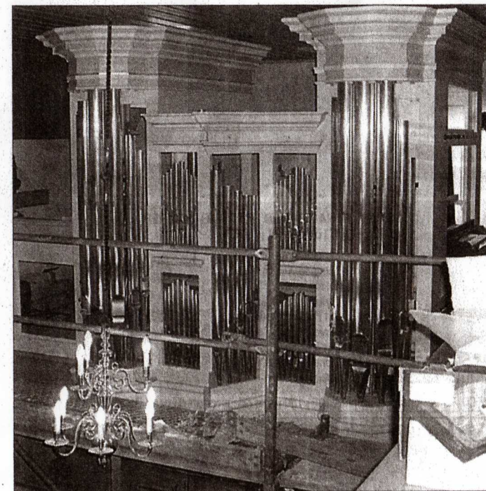
Eine Woche vor der Einweihung nimmt die Orgel in Holtorfs Kirche ihre endgültige Gestalt an. 2. Aufn.: C. Järnecke