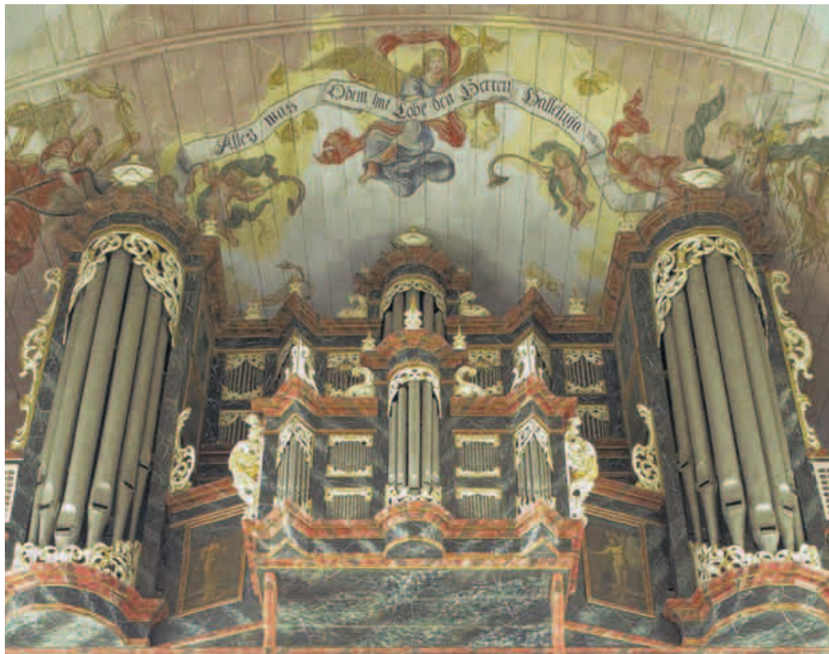
Das historische Schmuckstück muss dringend und aufwendig restauriert werden: die Arp-Schnitger-Orgel in der Neuenfelder St.-Pankratius-Kirche.

„Interessanterweise“, so der Orgelbauer gegenüber den HAN, „waren einige Beratungsleistungen vor allem deshalb so aufwendig, weil die Kirchengemeinde sich Zuschüsse zur Finanzierung der Dokumentation vonseiten des Kir-